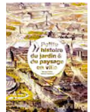
Petite histoire du jardin & du paysage en ville De Michel Péna et Michel Audouy Editions Alternatives, 2012