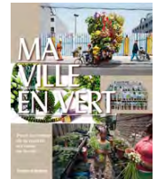
Ma ville en vert : pour un retour de la nature au coeur de la cité Editions Thames and Hudson, 2011.

::: Pour en savoir plus, n'hésitez pas à contacter main.verte@paris.fr ou 01 53 46 19 19.