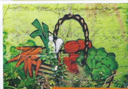
•Atelier peinture grandeur nature•